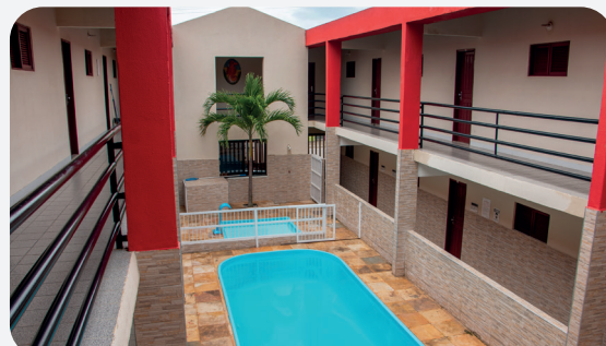
POUSADA DOS COMERCIÁRIOS

O sócio pode usufruir de toda a infraestrutura, com piscinas, campo de futebol society e quadra de esportes coberta, além do serviço oferecido na área de lazer, esporte, restaurante e outros. O Clube dos Comerciantes é uma parceria do sindicato com o SESC.