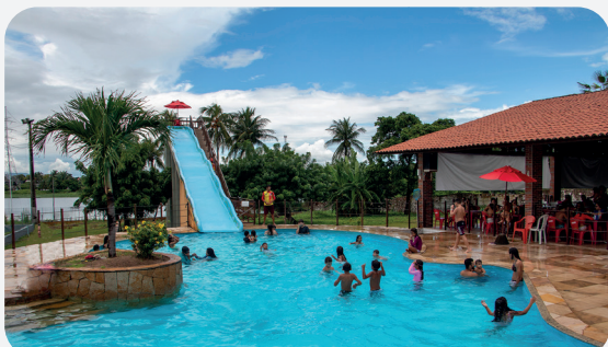
CLUBE DOS COMERCIÁRIOS/SESC

Fortaleça o seu sindicato e aproveite todos os benefícios. Juntos, fazendo mais!